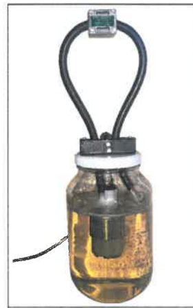
Фактическая система циркуляции